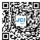
お申込みフォーム

ウェブにて受け付けております。下記QRコードから申し込みフォームにお進みください。 また申込み前に質問やご相談がございましたら、ご質問フォームまでお願いします。