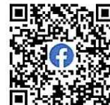
過去のわんぱく相撲動画 (八潮青年会議所 Facebook)