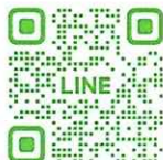
ご質問フォーム (八潮青年会議所 公式LINE)